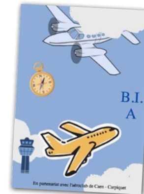
Le BIA, un programme complet pour découvrir l'aéronautique.

Le BIA permet aux élèves passionnés d'aéronautique ou qui ont le projet d'en faire le métier, de suivre un parcours de formation durant l'année de 2 de dans le cadre d'une convention passée avec l'aéroclub de Caen-Carpiquet.