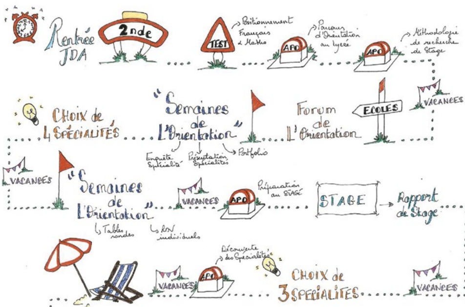
Le calendrier de l'AP orientation est corrélé aux grandes étapes de l'orientation.

Des séances d'AP orientation sont organisées en petit groupe, au long des années lycée, pour accompagner les différentes étapes de l'orientation. Elles sont accompagnées par un enseignant. L'élève garde les traces de l'ensemble de son parcours sur un support numérique.