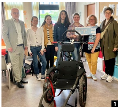
1 Les actions de solidarité organisées par les élèves ont permis de remettre 1 200 € à l'association Handy Rare et Poly pour permettre l'achat d'un fauteuil hippocampe (fauteuil tout terrain : courses, plage...).