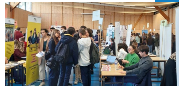
Forum des métiers et des formations.

Chaque année, le lycée accueille des établissements d'enseignement supérieur et des professionnels pour présenter les parcours d'orientation et des familles de métiers.