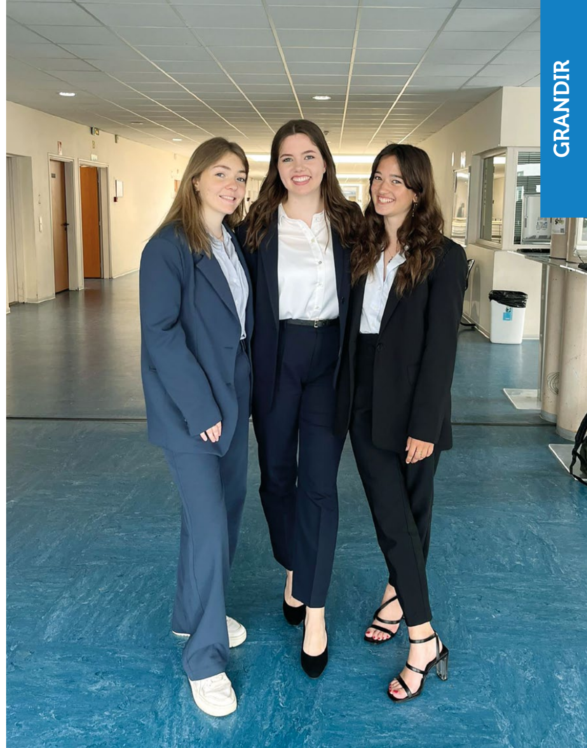
Des étudiantes de classe préparatoire économique et commerciale.