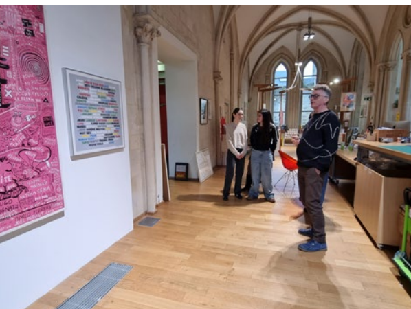
L'option arts plastiques donne par exemple l'occasion de faire des rencontres artistiques (Artothèque de Caen).

L'établissement propose les options facultatives suivantes : allemand (en distanciel), italien, russe LVC* ; arts plastiques ; latin.