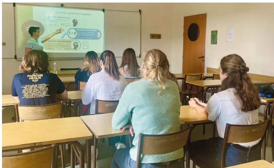
Les élèves de l'atelier d'initiation à la psychologie.

Des modules d'approfondissement en mathématiques et sciences-physiques sont proposés aux élèves qui souhaitent intégrer une classe préparatoire scientifique.