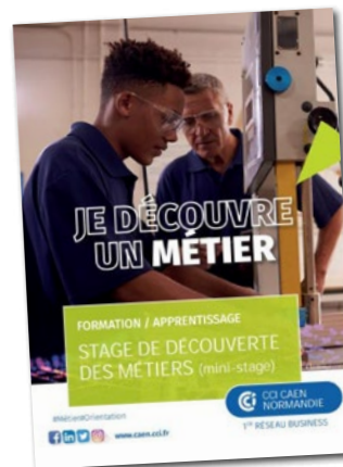
Des stages courts en période de vacances grâce à une convention passée avec la CCI.

Aux élèves qui souhaitent diversifier les expériences de découverte de métiers en entreprise, nous proposons d'effectuer des stages hors période scolaire.