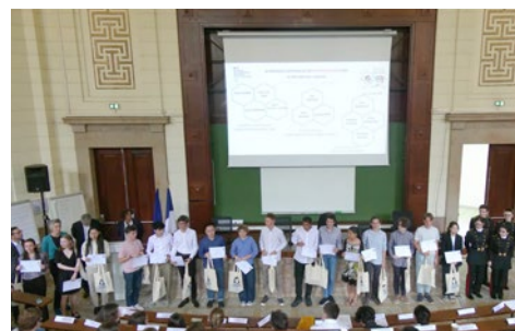
Les lauréats du 1 er prix académique aux olympiades de mathématiques et leurs professeurs accueillis au Ministère de l'Éducation Nationale pour recevoir la médaille d'argent.