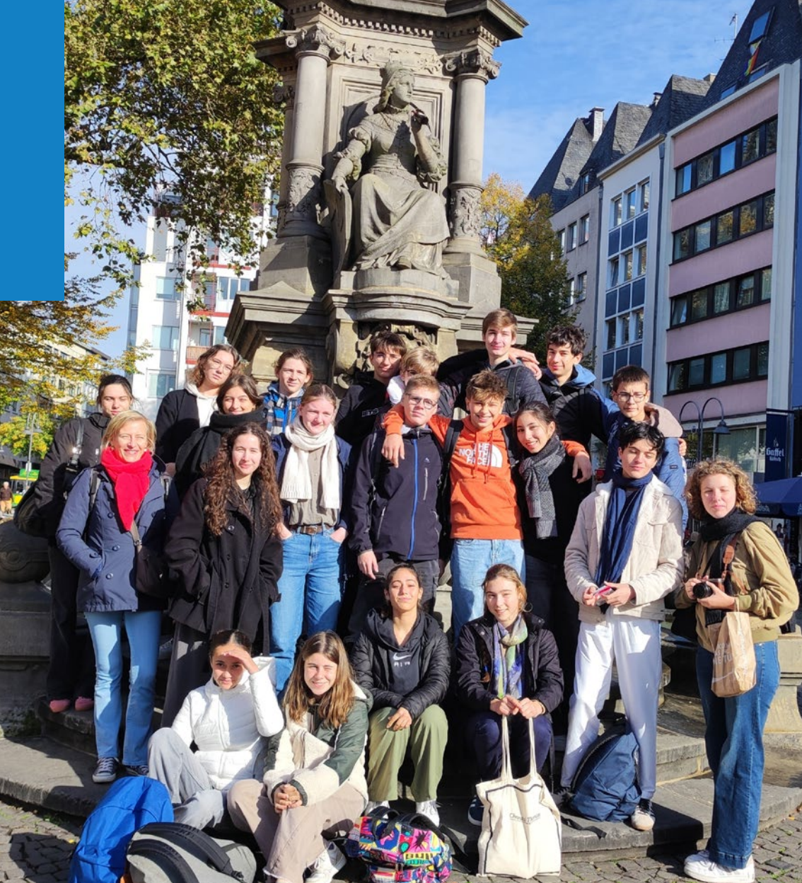
Aller à la rencontre des cultures et de l'Autre pour mieux l'accueillir et le comprendre : voyage d'élèves germanistes en Rhénanie.