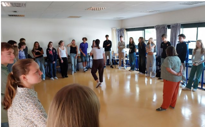
Dès la rentrée, tous les lycéens participent à une journée d'intégration pour mieux se connaître, créer du lien entre eux et travailler la relation inter-personnelle.