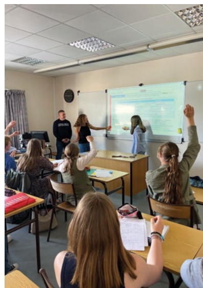
Réappropriation des bases de l'anglais en effectifs réduits le mercredi après-midi.

Des heures dédiées permettent de retravailler au 1 er semestre les bases du collège pour les élèves de 2 de qui en ont besoin.