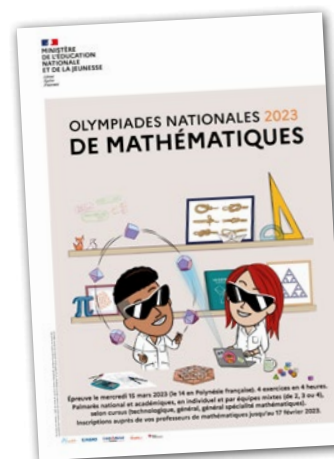
Participation aux épreuves individuelles et collectives des Olympiades de mathématiques.